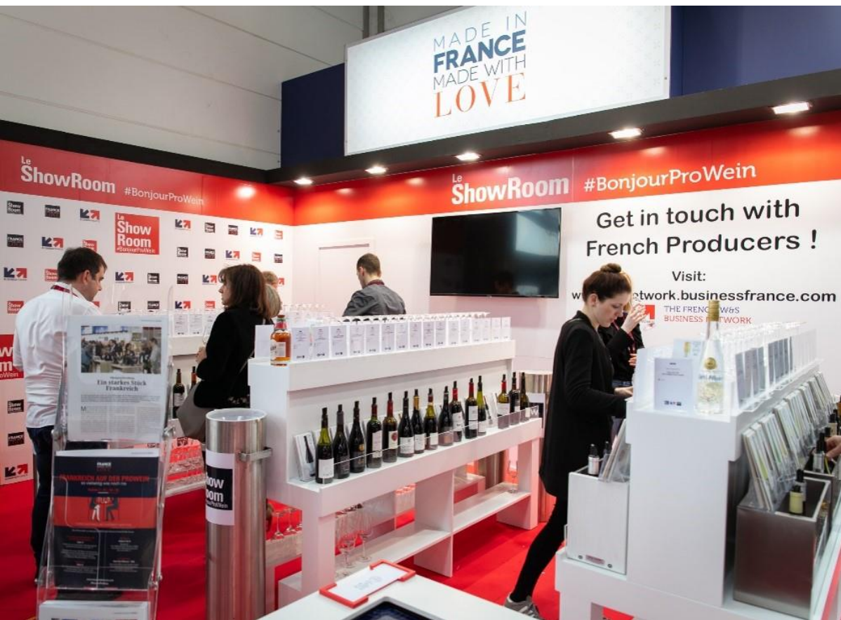
Le ShowRoom #Bonjour ProWein 2019