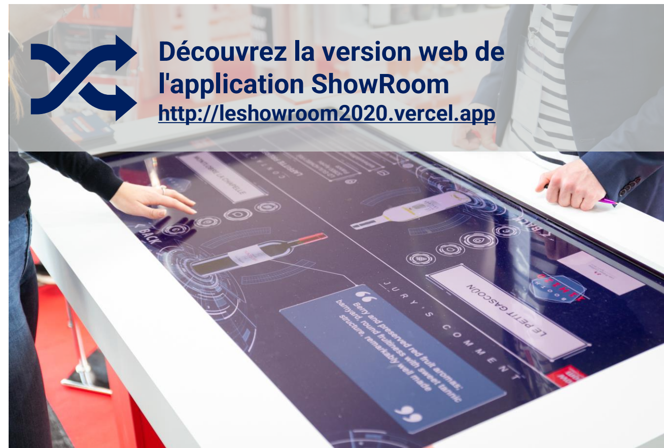
Le ShowRoom #Bonjour ProWein 2019