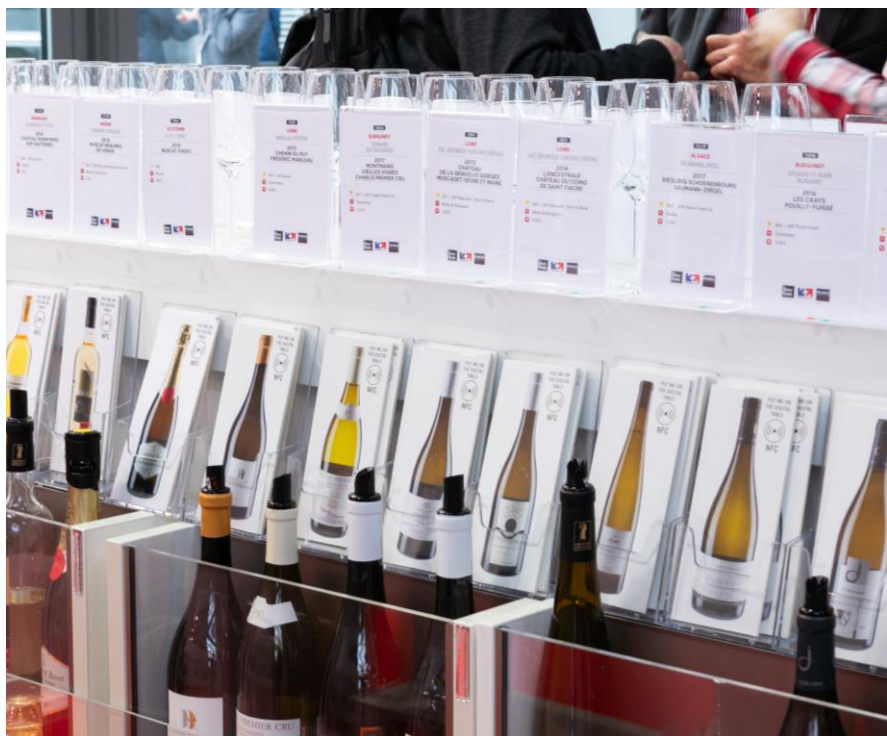
Le ShowRoom #Bonjour ProWein 2019