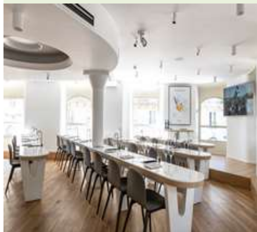
Dégustoir Rive Droite CIVB