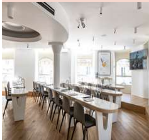
Dégustoir Rive Droite CIVB