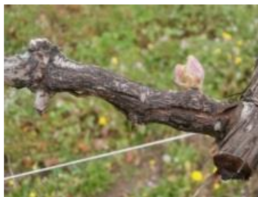
Symptômes sévère d'excoriose

Les symptômes d'excoriose peuvent être plus discrets sur les mérithalles (entre-nœuds) mais leur présence à la base des rameaux crée un étranglement des bois qui les rend extrêmement fragiles au pliage.