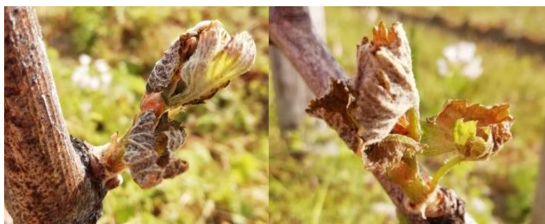
Vignes stades précoces, feuilles touchées (photos 31/03)