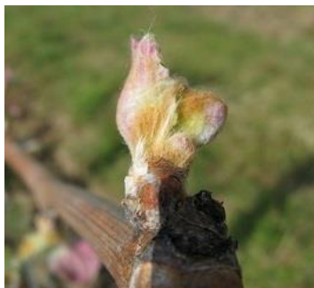
Stade D06- Eclatement du bourgeon