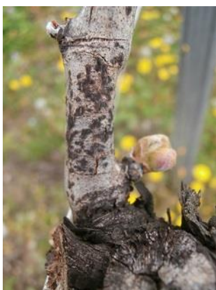
Symptômes d'excoriose discrets mais étranglement à la base du rameau

Il est important d'évaluer sur votre vignoble le niveau d'attaque sur les bois laissés à la taille. L'opération consiste à compter les bois laissés à la taille (astes et cots) présentant des symptômes (Cf. photo des symptômes). Les symptômes sont situés à la base des rameaux (en général sur les 3 premiers entre-nœuds) sous forme de nécroses brunâtres peu profondes, en forme de fuseau et de lésions étendues d'aspect ligneux ou de blanchiment des rameaux avec des ponctuations noires (pycnides).