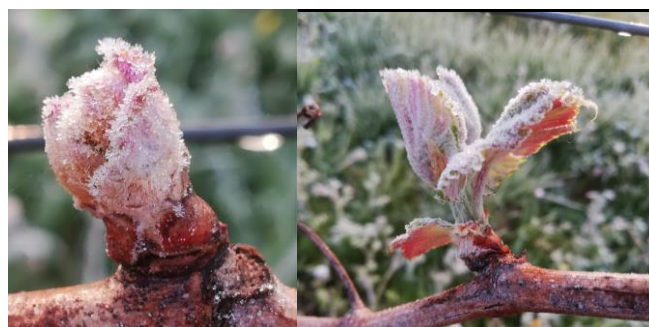
Bourgeons cristallisés à différents stades (photos 27/03)

Les températures douces annoncées dans les jours à venir, permettront de mieux voire réellement l'impact de cet épisode de gel.