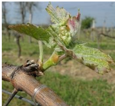
Stade E 09- 2 à 3 feuilles étalées