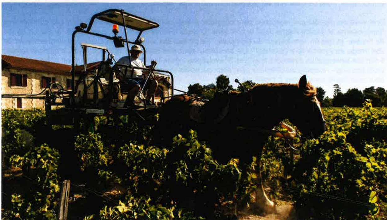
Château Pontet Canet à Pauillac en Gironde, le 18 août 2017.