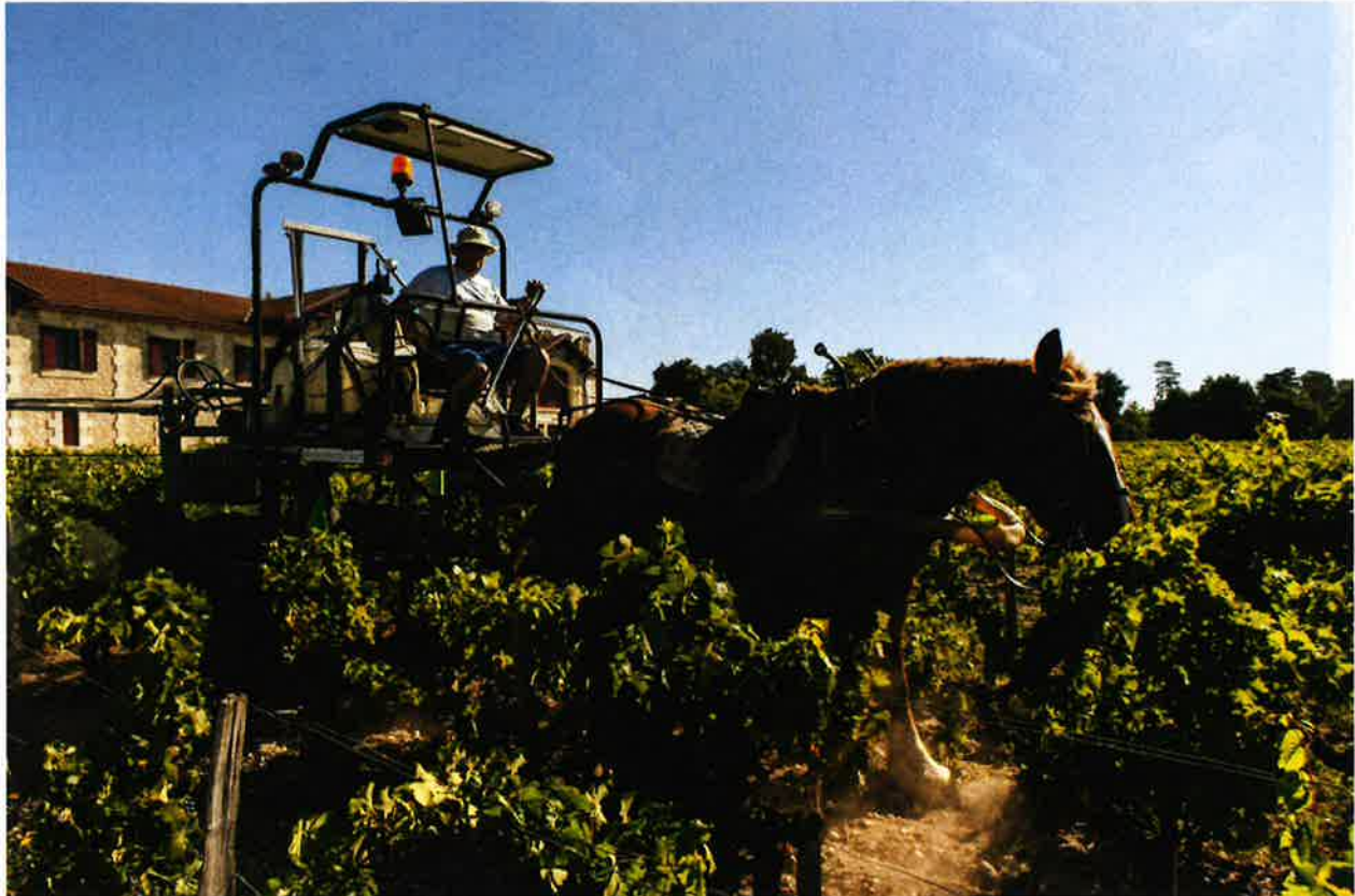
Château Pontet Canet à Pauillac en Gironde, le 18 août 2017.